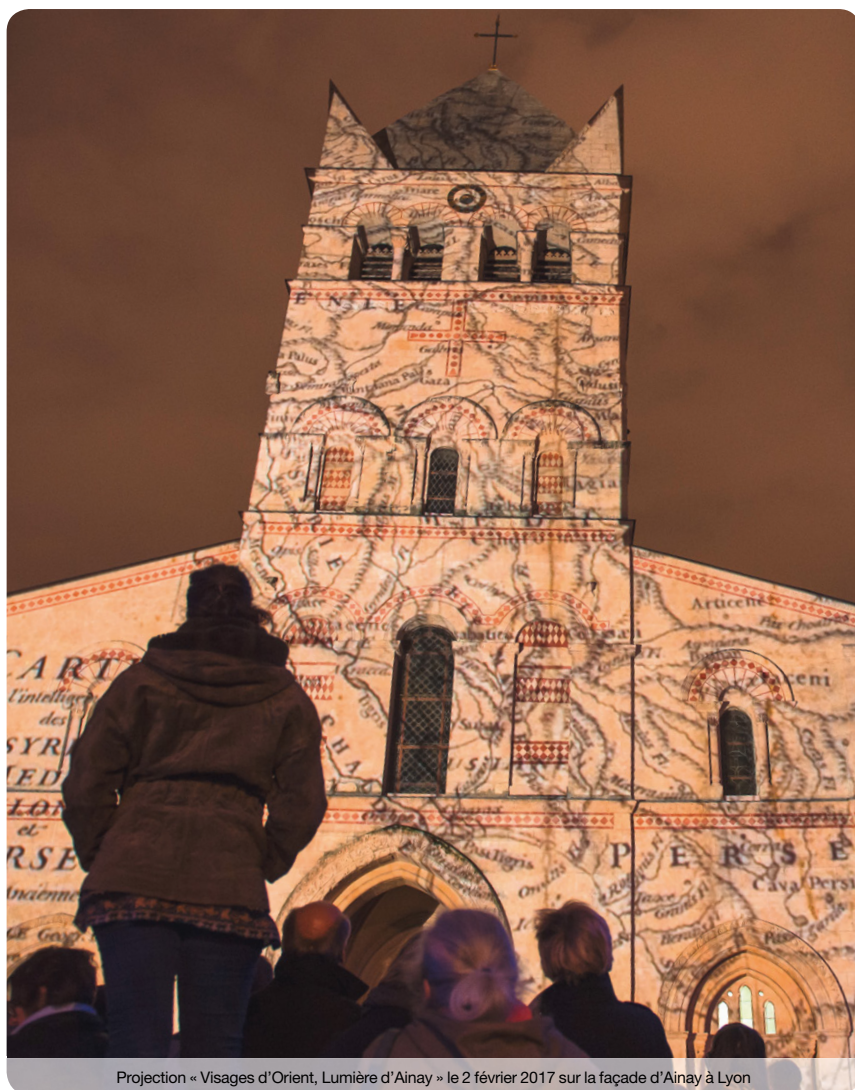
Projection « Visages d'Orient, Lumière d'Ainay » le 2 février 2017 sur la façade d'Ainay à Lyon

Dans le cadre du jumelage de Lyon avec Mossoul et pour célébrer la fête liturgique de la lumière, les 2 et 3 février, un spectacle son et lumière réalisé par Cor quo Vado – Agnès Winter – a présenté 3 000 ans d'histoire de la Mésopotamie. Cette projection, initialement prévue pour le 8 décembre 2015 dans le cadre de la fête des lumières, a permis de marquer de nouveau l'engagement et l'amitié des Lyonnais auprès des populations déplacées de la plaine de Ninive en Irak.