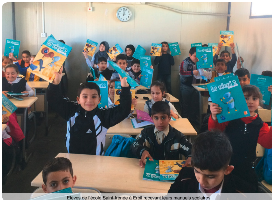
Elèves de l'école Saint-Irénée à Erbil recevant leurs manuels scolaires