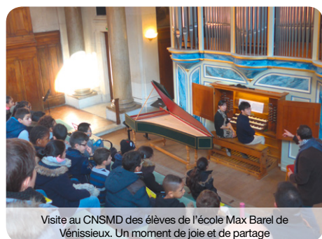
Visite au CNSMD des élèves de l'école Max Barel de Vénissieux. Un moment de joie et de partage

La musique comme langage universel et instrument de développement de l'enfant