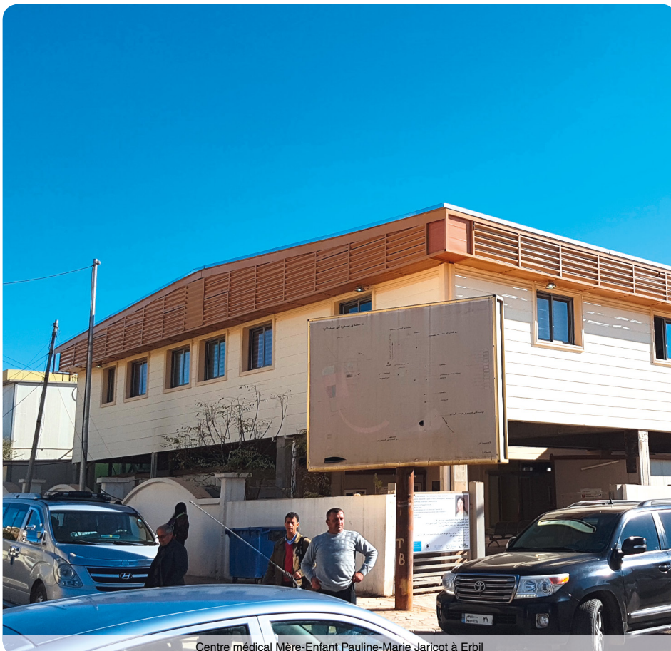
Centre médical Mère-Enfant Pauline-Marie Jaricot à Erbil