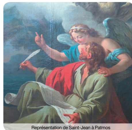
Représentation de Saint-Jean à Patmos

J'ai travaillé pendant 8 ans comme attachée-conservateur des antiquités et des œuvres d'art avant d'arriver en septembre 2015 à Lyon. Je dirige la commission d'art sacré et