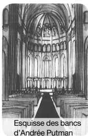
Esquisse des bancs d'Andrée Putman