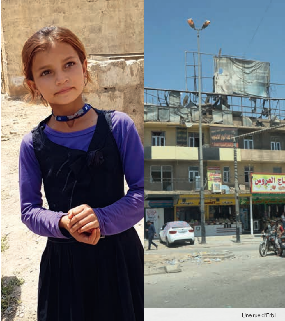
Une rue d'Erbil