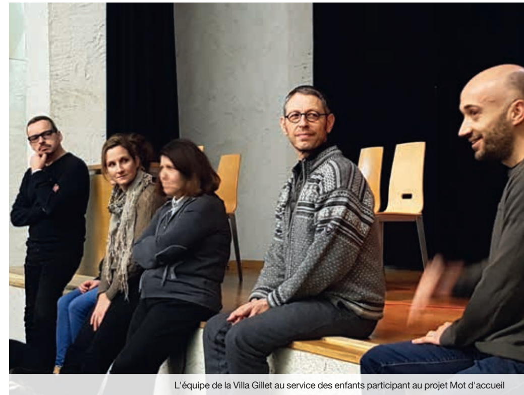
L'équipe de la Villa Gillet au service des enfants participant au projet Mot d'accueil