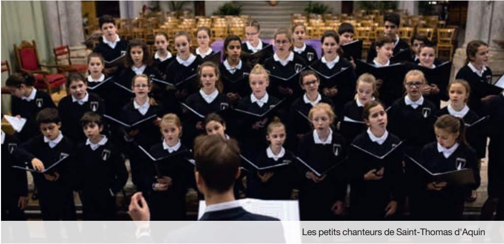
Les petits chanteurs de Saint-Thomas d'Aquin

Les jeunes du chœur Mik'Ados ont entre 12 et 18 ans. L'âme de ce chœur est sa diversité : quelques enfants sont porteurs de handicap (physique ou mental), d'autres vivent des situations personnelles compliquées. Sans aucun critère de recrutement, ni d'audition d'entrée, les choristes intègrent le chœur par motivation et plaisir de chanter. Depuis quelques années, le chœur Mik'Ados participe à des festivals durant l'été. Cette année, direction Tallinn en Estonie. Du 27 juillet au 5 août 2018, s'y tiendra le plus grand festival international de chant choral en Europe qui rassemblera plus de 4 000 choristes. Les Mik'Ados participeront à des ateliers de chant, des concerts et des visites, avec le soutien financier de la Fondation. Une belle occasion de découvrir le patrimoine culturel de l'Estonie qui fêtera ses 100 ans d'existence cette année... en chansons !