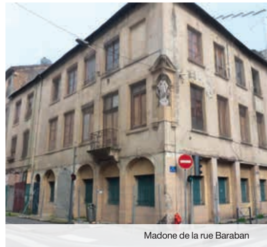
Madone de la rue Baraban

En 2008, répondant à l'initiative de l'association Les madones de Lyon et de la pastorale du tourisme du diocèse de Lyon, la Ville de Lyon a manifesté la volonté d'engager, avec les propriétaires des immeubles