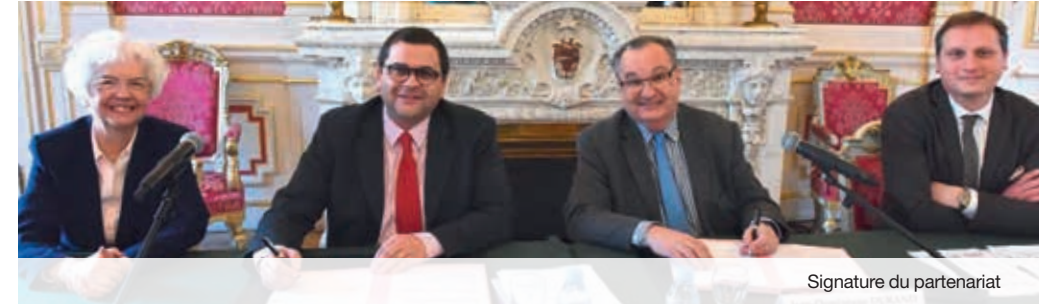
Signature du partenariat

Afin de poursuivre ces travaux essentiels pour achever la restauration de l'église, un partenariat public-privé original a été mis en place. En effet, cette opération est rendue