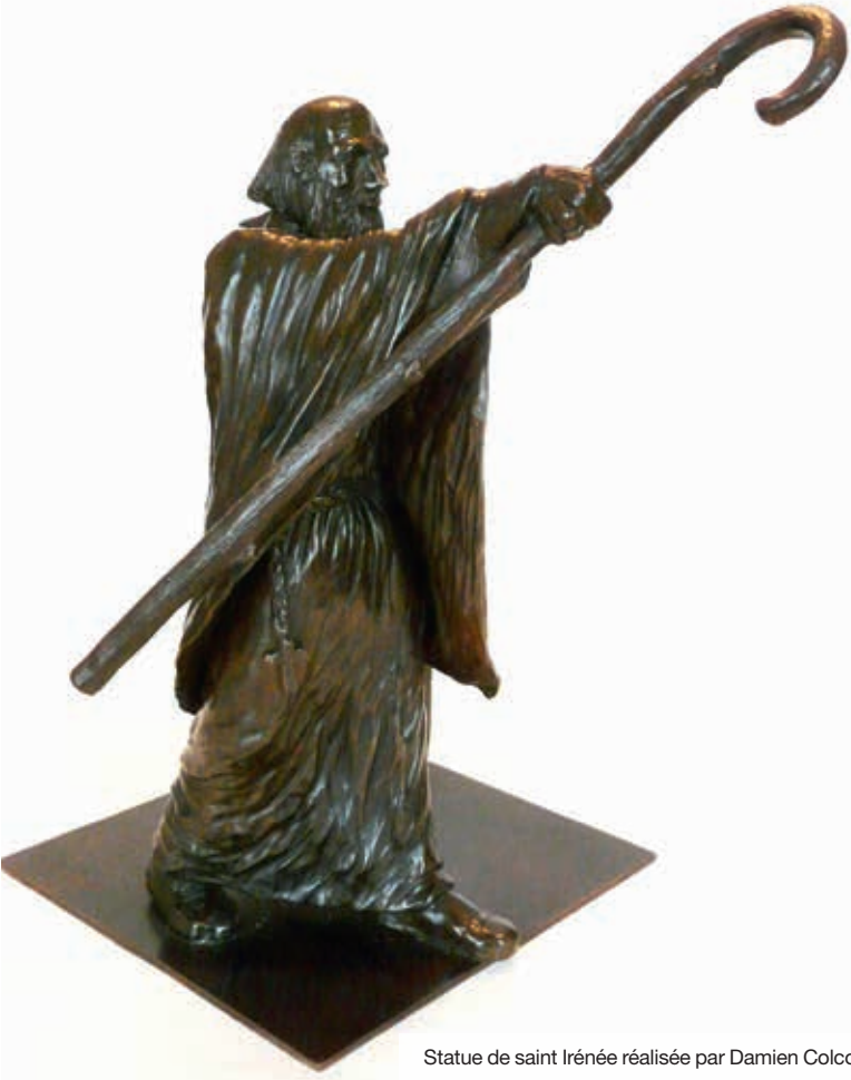
Statue de saint Irénée réalisée par Damien Colcombet