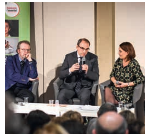
Lancement du site - mesopotamiaheritage.org