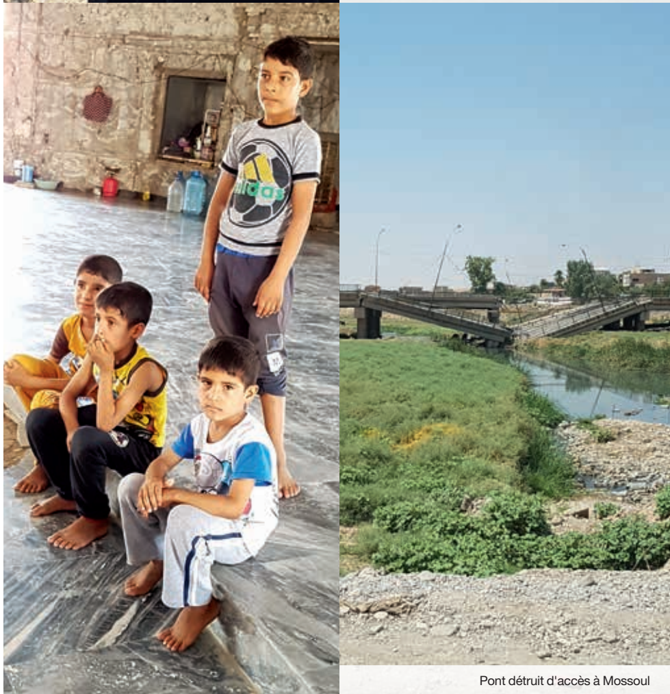
Pont détruit d'accès à Mossoul