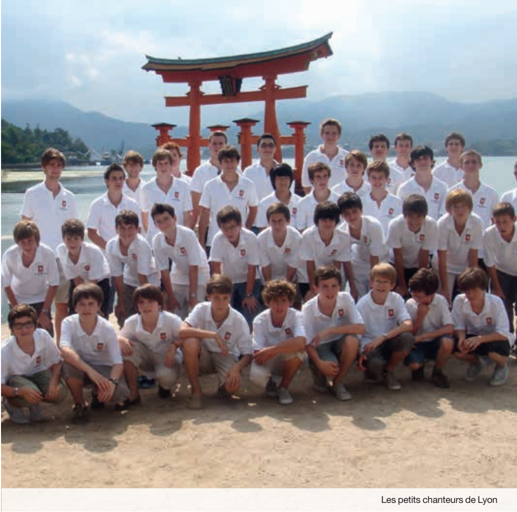
Les petits chanteurs de Lyon

vivent un double engagement, spirituel et musical, ainsi qu'une discipline personnelle et collective. Soutenus par la Fondation pour leur fonctionnement annuel, les Petits Chanteurs de Lyon sont au service de la beauté et de la musique, mais aussi au service des habitants de Lyon et du