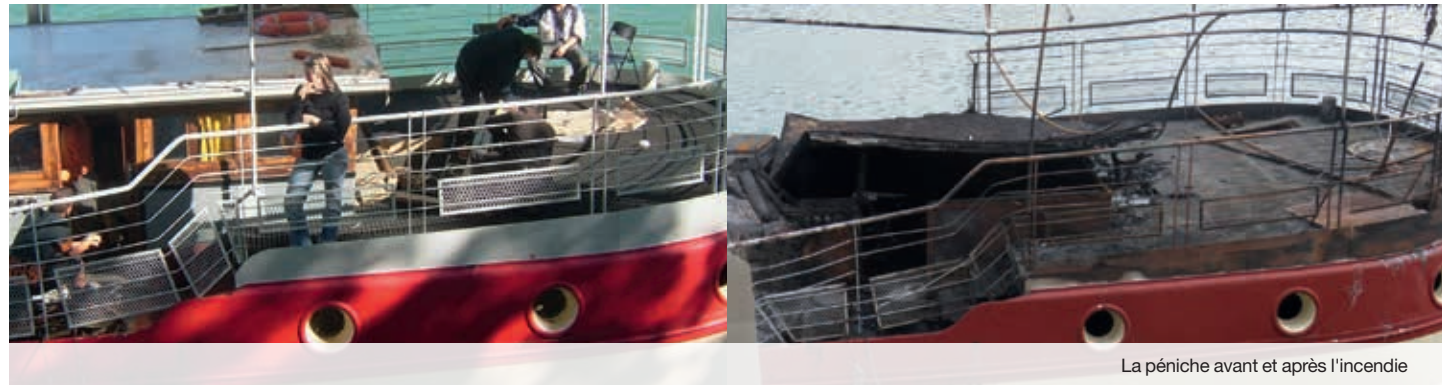
La péniche avant et après l'incendie