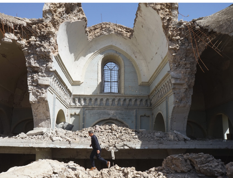
Ruines de la cathédrale syriaque catholique Al-Tahira de Mossoul