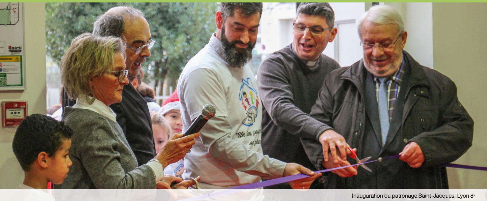
Inauguration du patronage Saint-Jacques, Lyon 8°

LES PROJETS SOUTENUS PAR LA FONDATION P.2-6