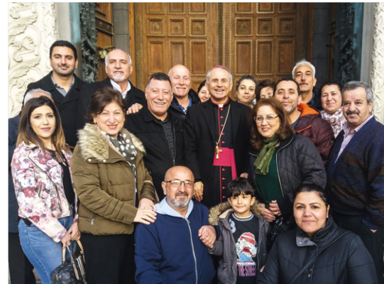
Monseigneur Najeeb entouré de fidèles