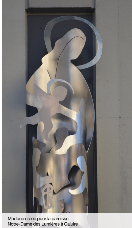
Madone créée pour la paroisse Notre-Dame des Lumières à Caluire

La mission de l'association pour la sauvegarde d'un patrimoine discret dans le paysage urbain lyonnais continue à explorer des nouvelles pistes et notamment dans la restauration des statues, comme celles installées aux angles de la maison du Soleil (Place de la Trinité, Lyon 5 e ), ainsi que vers