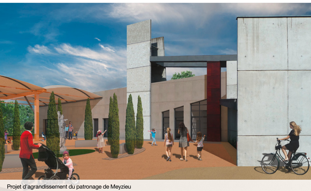
Projet d'agrandissement du patronage de Meyzieu